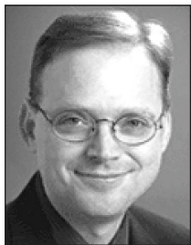
Кевин А. Хассетт

Научный сотрудник АИП и финансовый обозреватель газеты «Вашингтон пост»